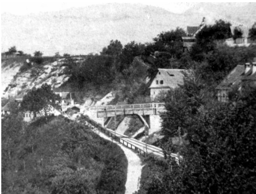
Urejanje postajališča v Radovljici, ok. 1890